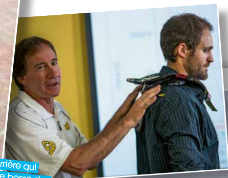
Le modèle pour la route (STX, à gauche) propose des branches arrière qui s'appliquent sur les omoplates, de chaque côté de la traditionnelle bosse des combinaisons de piste. Mais les crossmen ayant besoin de plus de mobilité, le modèle tout-terrain a une languette centrale qui prend appui sur la colonne, ce qui est source de polémique.