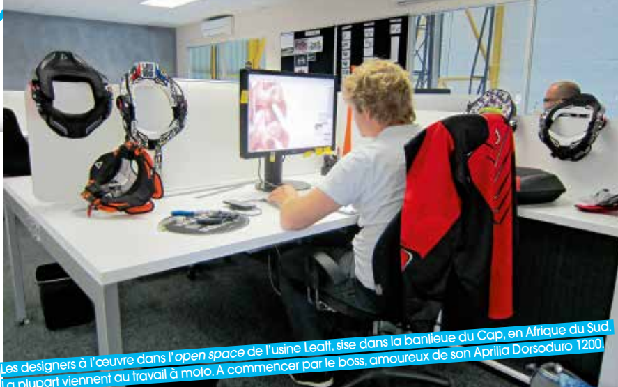
Les designers à l'œuvre dans l'open space de l'usine Leatt, sise dans la banlieue du Cap, en Afrique du Sud. La plupart viennent au travail à moto. A commencer par le boss, amoureux de son Aprilia Dorsoduro 1200.