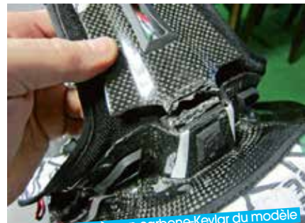
La languette arrière en carbone-Kevlar du modèle tout-terrain, dont l'appui sur la colonne est décrié par les détracteurs du collier cervical, a été brisée à la main. La force idéale pour le seuil de rupture est étudiée minutieusement, pour protéger sans blesser.

l'amplitude au pilote. « Pour réaliser le STX, on a bien sûr visionné des cas d'accidents en vidéo, mais on a surtout bossé en labo. D'une certaine manière, on peut avoir des tas d'accidents très différents en vidéo, pour autant les blessures sont souvent les mêmes et nos ingénieurs parviennent à les reproduire avec des simulations. On a beaucoup travaillé avec BMW sur des mannequins que l'on faisait glisser à terre avec des câbles reliés à leur casque. On a étudié des tas d'impacts sur les casques. » Rendez-vous en avril pour le premier essai du Leatt Brace. ●