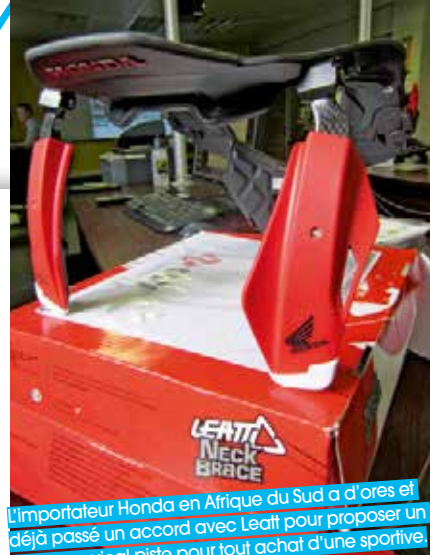
L'importateur Honda en Afrique du Sud a d'ores et déjà passé un accord avec Leatt pour proposer un collier cervical piste pour tout achat d'une sportive.

raboté les supports latéraux, tout en travaillant sur le défaut principal de la première version du STX : le becquet rigide à l'avant qui butait sur le réservoir en position de recherche de vitesse. Je l'avais moi-même testé et désapprouvé lors des essais du Bol d'or 2012, remontant l'information à Scott, qui commercialisait alors le produit Leatt sous sa propre marque. L'évolution du STX comprend désormais un becquet articulé, qui protège de l'hyperflexion (mouvement extrême de la tête vers l'avant), mais qui se replie au contact du réservoir, laissant toute